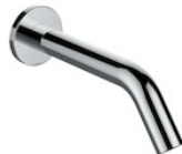
Wanneneinlauf, Ausladung 175 mm, verchromt 3713300040601