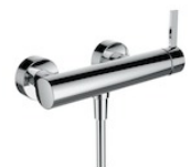
Aufputz-Einhebel- Duschenmischer, 1-Weg- Mengenregulierung, mit Zubehör 3313370041411