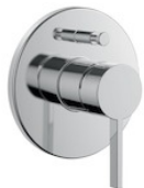
Fertigmontageset für Unterputz-Einhebel- Bademischer mit Umsteller, mit integriertem Rohrunterbrecher 3213360040101