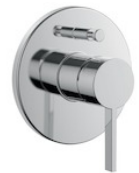
Fertigmontageset für Unterputz-Einhebel- Bademischer mit Umsteller, verchromt 3213360040001