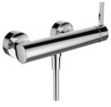
Aufputz-Einhebel- Duschenmischer, 1-Weg- Mengenregulierung, ohne Zubehör