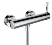
Aufputz-Einhebel- Duschenmischer, 1-Weg- Mengenregulierung, mit Zubehör 3313370041411